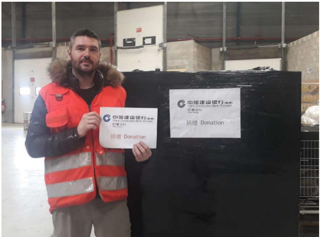
建行巴黎分行第一时间筹集紧缺物资，捐赠法国红十字会

3月份，在欧洲各国陆续封城的紧要关头，分行密切联系中远海运，通过全天24小时不间断的运输保障，驰援6000公里，协助周边6个国家建行机构，完成稀缺医疗物资的跨境运输任务，确保所在地区分行的口罩第一时间运达，并捐赠当地一线医疗机构和急需人群。