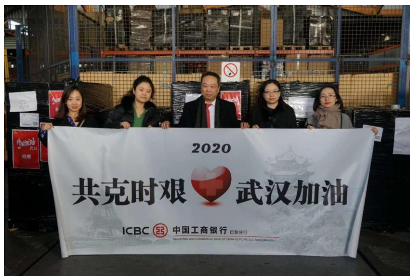
图 6 工商银行巴黎分行的 5 名湖北武汉籍员工在捐赠物资前为家乡加油