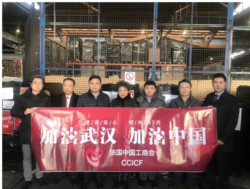
图 5 中广核欧洲能源公司、工商银行巴黎分行、华天中国城、华中科技大学法国校友会等单位代表在巴黎戴高乐机场安排物资发运事宜，此批物资将由中国国际航空公司协助运往湖北武汉。

运抵湖北。中国工商银行巴黎分行通过国航承运的第一批捐赠的 5 万只 N95 口罩目前已运抵湖北，第二批捐赠的 20 万只 N95 口罩目前也在备货中。