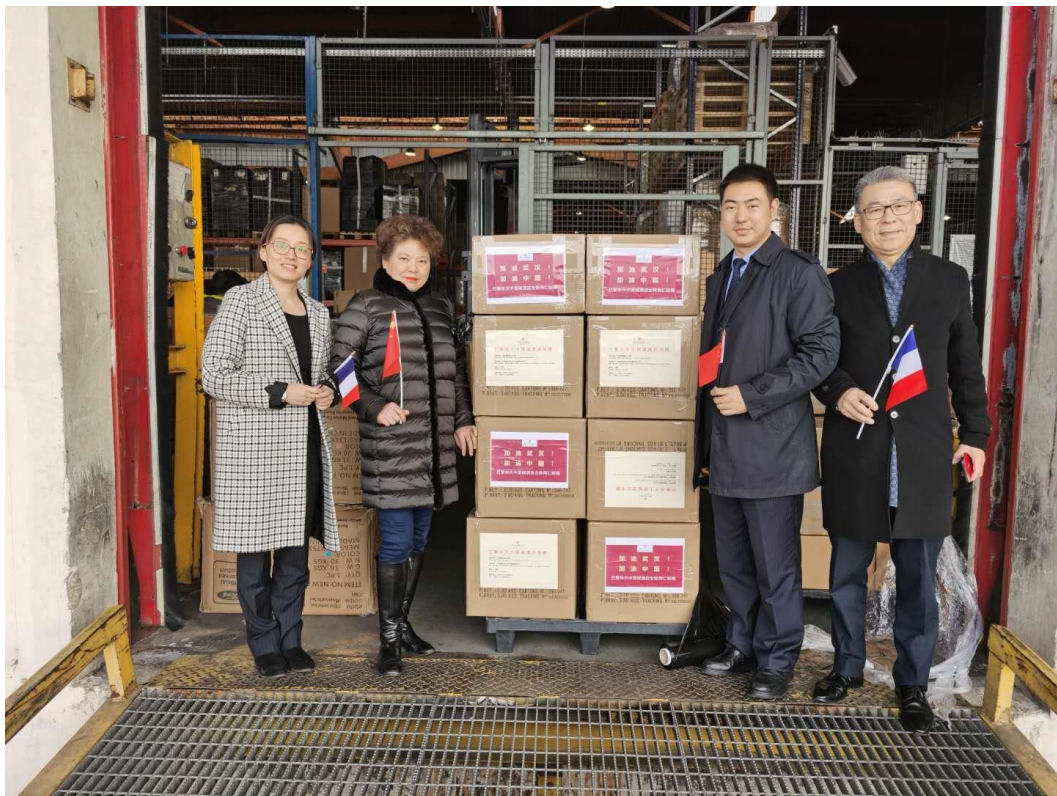
图9 华天中国城酒店捐赠医用口罩