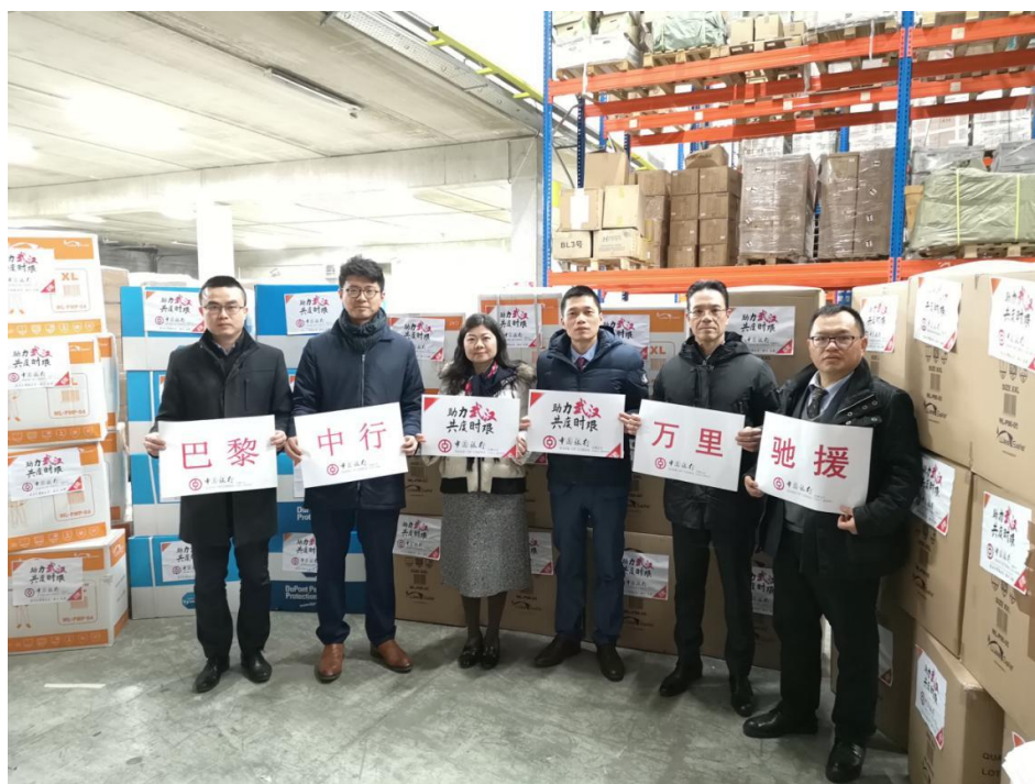
图 1、图 2 中国银行巴黎分行将捐赠物资送达机场物流仓库