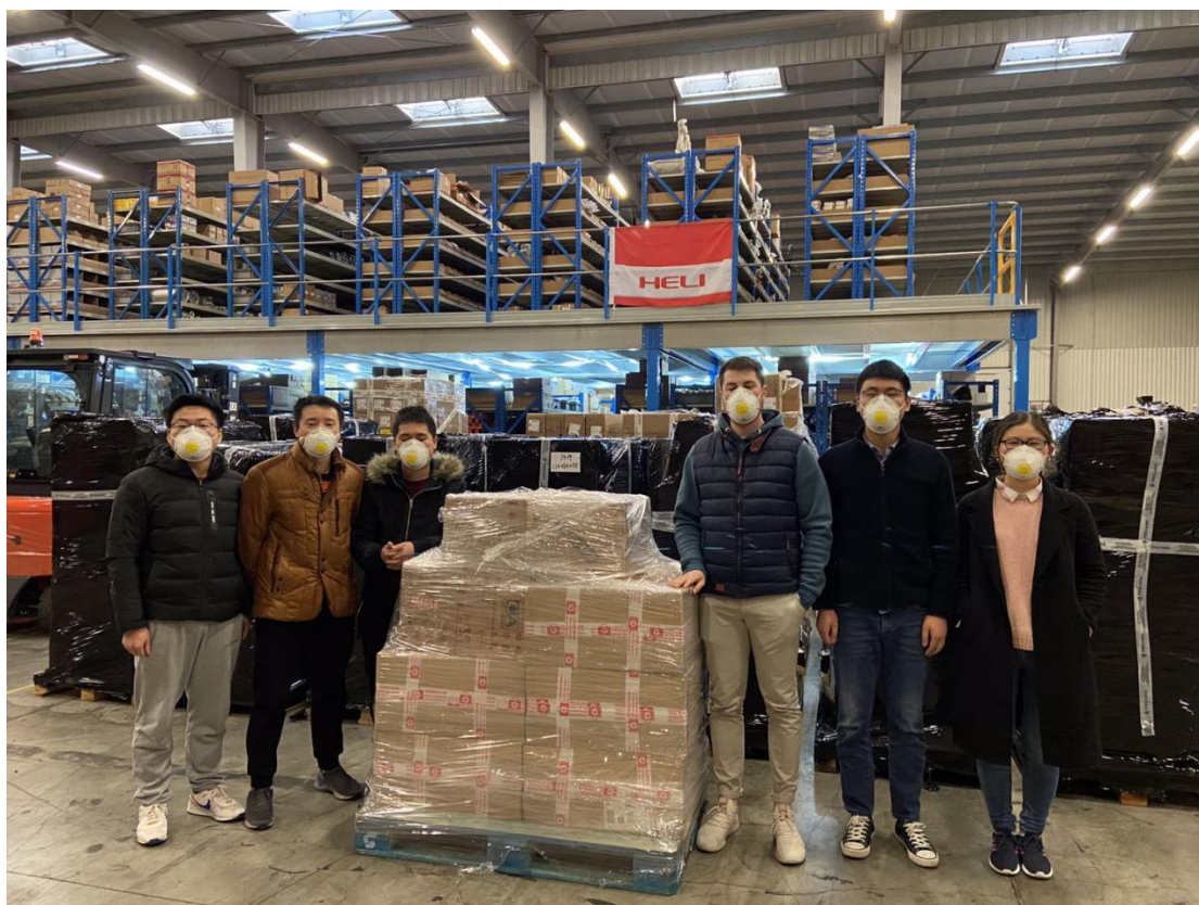
图 10 合力叉车将第二批赠物资运送至机场物流货仓

安徽合力叉车法国公司分三批将 1000 副护目镜，11250 套防护服,5700 个一次性帽子,1250 件一次性隔离衣，17450 只 FFP2 口罩，3550 只 FFP3 口罩等物资寄送到安徽。