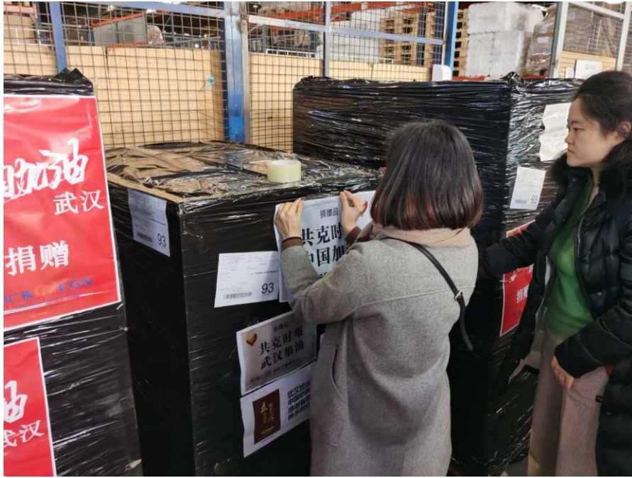
图 7 在法中资企业武汉籍员工为家乡鼓劲！

尽管酒店、旅游行业受到疫情较大影响，营收和利润缩水。巴黎华天中国城酒店迅速行动，紧急采购 1.72 万只医用口罩并寄往湖南省红十字会。巴黎欧乐途旅行社联系供货商，于 2 月 1 日将 4 万只医用口罩寄往湖北。