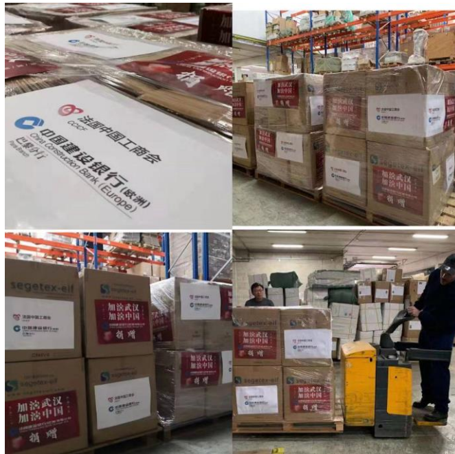
图 4 建行巴黎分行将捐赠物资运往东航在巴黎机场的货仓