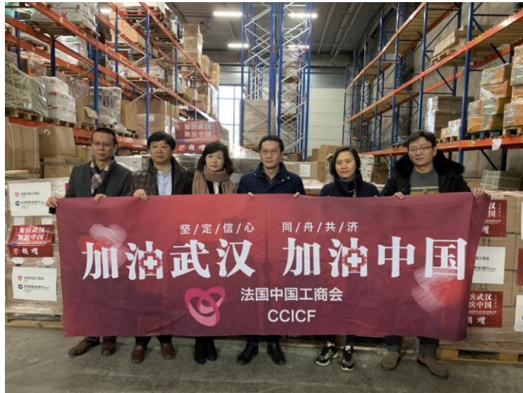
图 3 建行巴黎分行、东航欧洲营销中心人员在捐赠物资前

中国建设银行巴黎分行迅速行动，率先联系医疗防护用品货源并组织紧急发运物资。截至目前已先后向湖北发运五批共 30 余吨医用口罩，防护鞋套，防护手套，防护服，护目镜和消毒产品等用品。